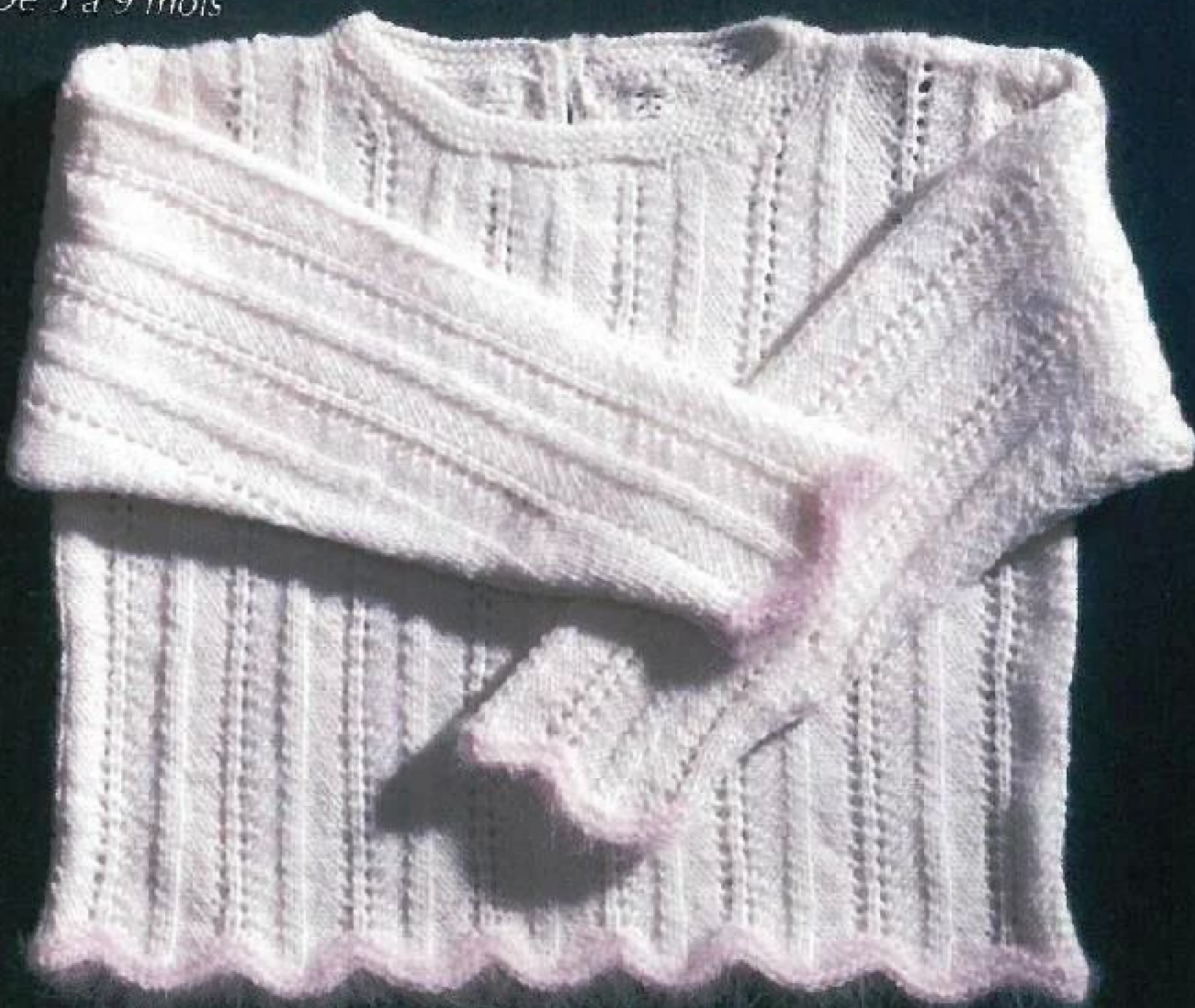
Modèle 19 De 3 à 9 mois

Bébé pare de douceur de la tête aux pieds avec cet ensemble tricoté en laine pe gnée et un soupçon d'angora. La pureté d blanc et la finesse de laine en font une véri table tenue de gala ! C soir, Bébé est de sortie !